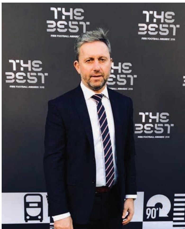
JERZY BRZĘCZEK GALA WRĘCZANIA NAGRÓD DLA NAJLEPSZEGO PIŁKARZA FIFA FOOTBALL AWARDS 2018 W LONDYNIE

„Truskolasy są w moim sercu - tu się urodziłem, wychowałem, tu stawiałem pierwsze kroki na boisku(...) Zawsze z dumą podkreślam, gdzie są moje korzeni i skąd pochodzę...” (Jerzy Brzęczek)