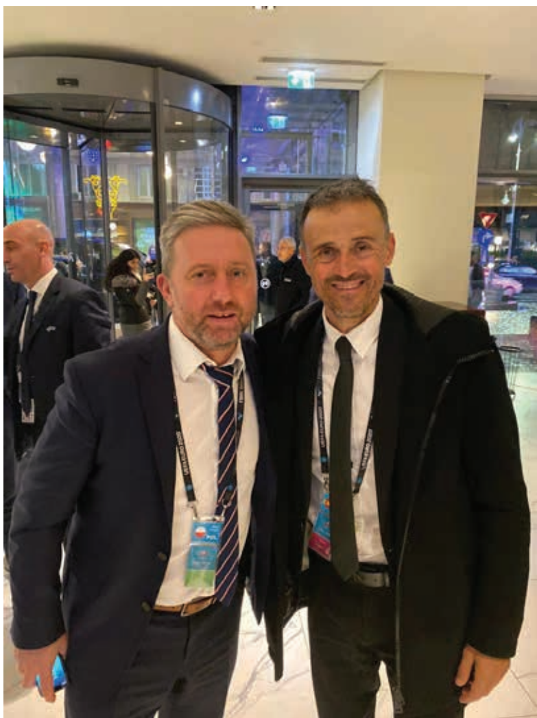
JERZY BRZĘCZEK Z LUISEM ENRIQUE PO LOSOWANIU GRUP EURO 2020

Czy to jest tak, że zapamiętujemy tych, którzy przekazali nam jakieś wartości?