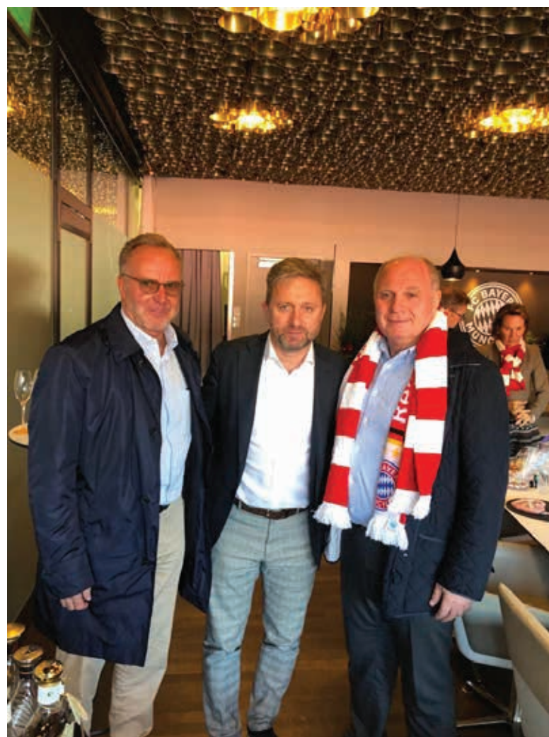
JERZY BRZĘCZEK STADION BAYERNU W MONACHIUM. LEGENDY NIEMIECKIEJ PIŁKI. KARL-HEINZ RUMMENIGGE (Z LEWEJ), ULI HOENESS.JPG

W Pana książce jest taki fragment, który mówi o życzeniach z okazji Świąt Bożego Narodzenia w 2017 r. Kiedy synowie życzyli