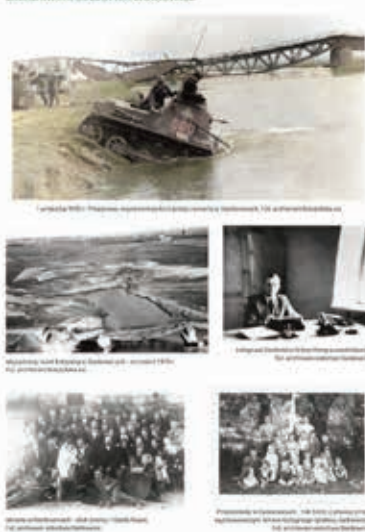
Z ARCHIWUM SOŁECTWA DANKOWICE

W ramach projektu powstał również pamiątkowy folder „Dankowice wczoraj i dziś”.