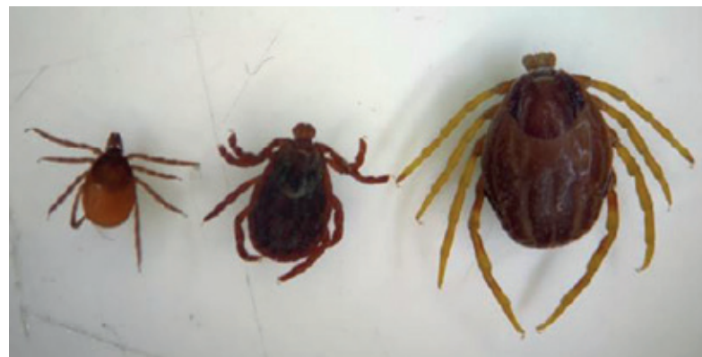
człowieka, dlatego warto o siebie odpowiednio zadbać i regularnie sprawdzać swoje ciało.

Gdy kleszcz Hyalomma przyczepi się do skóry, może pozostać na niej przez dłuższy czas, co zwiększa ryzyko transmisji patogenów do organizmu