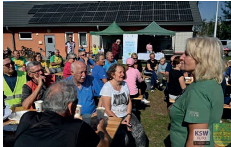
stajń jest żywa i wciąż cieszy się dużym zainteresowaniem.

IV Rajd Rowerowy im. Bogusława Leszczyńskiego ponownie udowodnił, że miłośników dwóch kółek w naszej gminie nie brakuje, a tradycja wspólnej, aktywnej wyprawy wokół gminy Przy-