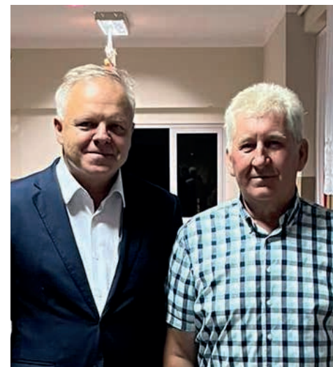
SMUGI SOŁTYS WIESŁAW ZYCH BURMISTRZ GMINY KŁOBUCK JERZY ZAKRZEWSKI