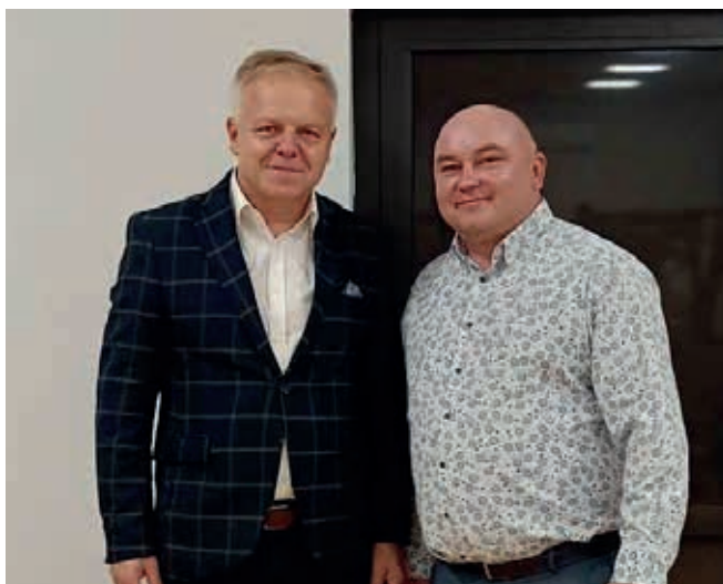
KAMYK. ŁUKASZ TRZEPIZUR BURMISTRZ GMINY KŁOBUCK JERZY ZAKRZEWSKI