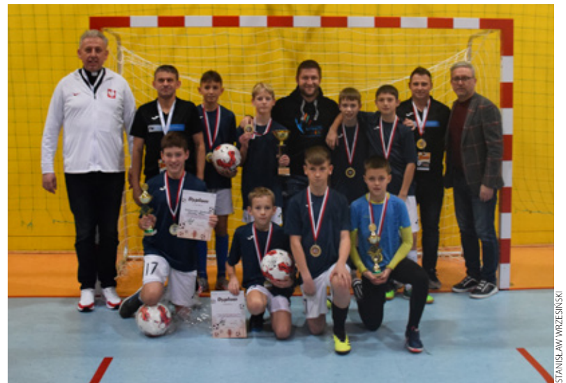
Zwycięska drużyna SP Truskolasy z gośćmi honorowymi, opiekunami i nagrodami.